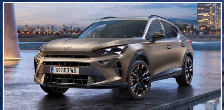
DER NEUE FORMENTOR