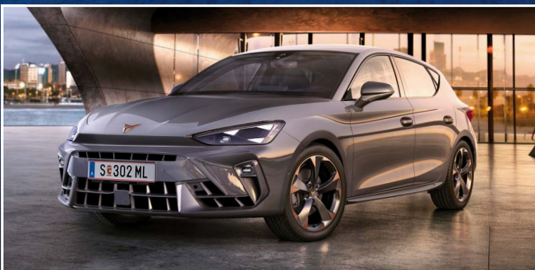
DER NEUE LEON